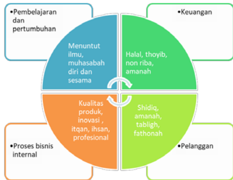
Gambar 1. Skema Balance Scorecard Berbasis Syari'ah

Dalam perspektif syariah , perintah membaca, belajar dan menuntut ilmu dijalankan. Pembinaan ketaqwaan karyawan juga harus serius dilaksanakan Karen akan berdampak kepada kenaikan produktivitas perusahaan.