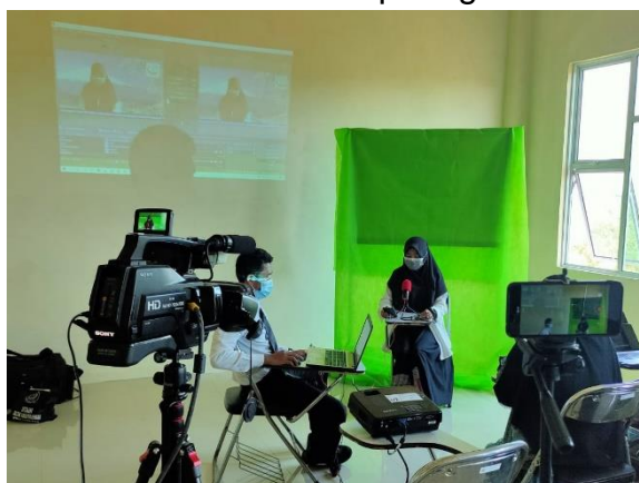
Gambar 2. Penggunaan Aplikasi OBS dalam Pembelajaran

Pemanfaatan aplikasi OBS Studio dapat dilihat pada praktik penyiaran dalam pembelajaran yang melibatkan mahasiswa seperti gambar berikut :