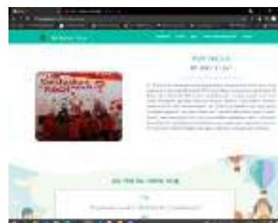
Gambar 4. Halaman Profil

Pada halaman profil ini user dapat melihat gambaran umum informasi sekolah RA Bahrul Ulum. Pada halaman ini berisikan tentang profil sekolah. Halaman Profil Sekolah dapat dilihat pada Gambar 4.