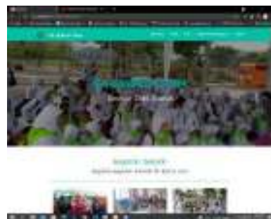
Gambar 3. Halaman Beranda

Halaman beranda merupakan halaman utama, halaman yang muncul pertama kali ketika pengguna membuka website Sekolah RA Bahrul Ulum. Halaman Beranda dapat dilihat pada Gambar 3.