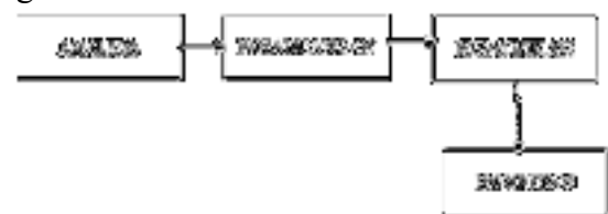
Gambar 1. Metode Penelitian

Metode penelitian merupakan langkah-langkah yang dilakukan dalam penelitian ini, seperti ditunjukkan pada gambar :