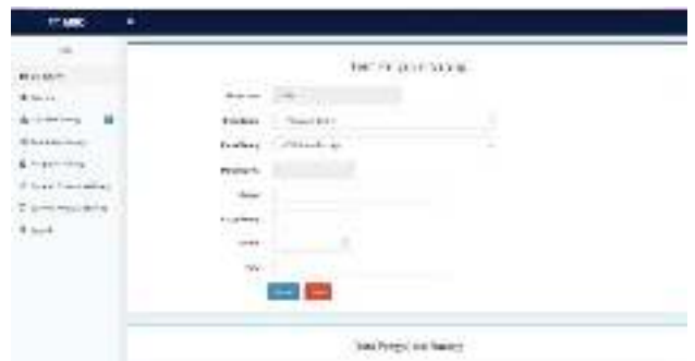
Gambar 8 Halaman Form Pengajuan Barang

Halaman ini menampilkan proses penginputan pengajuan barang alat tulis kantor untuk menambahkan stock yang tersedia dapat dilihat pada gambar 8 berikut ini.