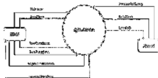
Gambar 3. Diagram Konteks

Diagram aliran data menggambarkan padangan sejauh mungkin mengenai masukan, proses dan keluaran sistem, yang berhubungan dengan masukan, proses, dan keluaran dari mode sistem umum.