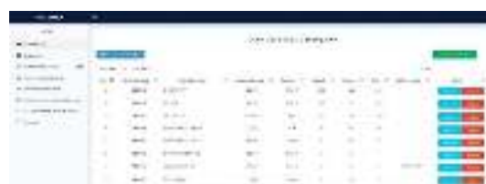
Gambar 4 Halaman Data Stock Barang ATK

Pada Halaman Data Stock Barang ATK menampilkan stock barang alat tulis kantor yang tersedia sesuai dengan stock fisik, dapat dilihat pada gambar 4 berikut ini.