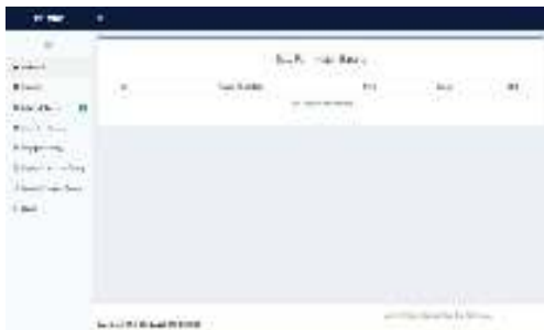
Gambar 5. Halaman Data Permintaan Barang

Halaman ini menampilkan data permintaan barang yang di input user level personal, kemudian di proses user level administrator untuk memproses permintaan barang alat tulis kantor, terlihat pada gambar 5 berikut ini.