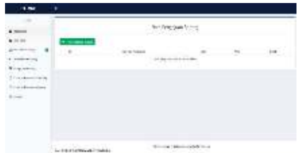
Gambar 7 Halaman Data Pengajuan Barang

Halaman ini menampilkan data proses pengajuan barang, yang dilakukan user level administrator untuk menambah stock alat tulis kantor dapat dilihat pada gambar 7 berikut ini.