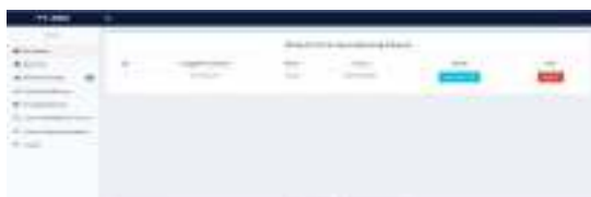
Gambar 6 Halaman Data Permintaan Barang Keluar

Halaman ini menampilkan barang yang sedang di proses pemenuhan permintaan personal alat tulis kantor, dapat dilihat pada gambar 6 berikut ini.