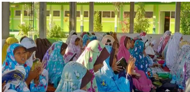
Gambar 2. Kegiatan Literasi Al-Qur'an Siswa

Gambar 2 menunjukkan kegiatan literasi Al-Qur'an yang dilakukan oleh siswa sebagai bagian dari pembiasaan dalam membentuk karakter religius. Dalam gambar tersebut terlihat siswa membaca Al-Qur'an secara bersama-sama dengan bimbingan guru sebelum memulai proses pembelajaran. Kegiatan ini dilaksanakan secara rutin dengan tujuan meningkatkan kemampuan membaca Al-Qur'an, memperbaiki tajwid, serta menanamkan nilai-nilai spiritual dalam diri siswa. Selain itu, melalui kegiatan literasi ini, siswa dibiasakan untuk mencintai Al-Qur'an dan menjadikannya sebagai pedoman dalam kehidupan sehari-hari. Dengan demikian, kegiatan yang ditampilkan pada gambar 2 mencerminkan upaya sekolah dalam mengintegrasikan nilai-nilai religius ke dalam aktivitas belajar siswa secara berkelanjutan.