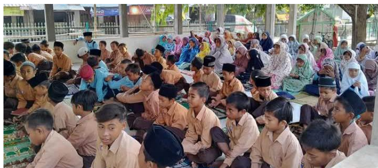
Gambar 3. Kegiatan ba'da shalat Dhuha berjamaah

ke pembelajaran inti, dan diikuti oleh seluruh siswa dengan tingkat partisipasi yang tinggi.