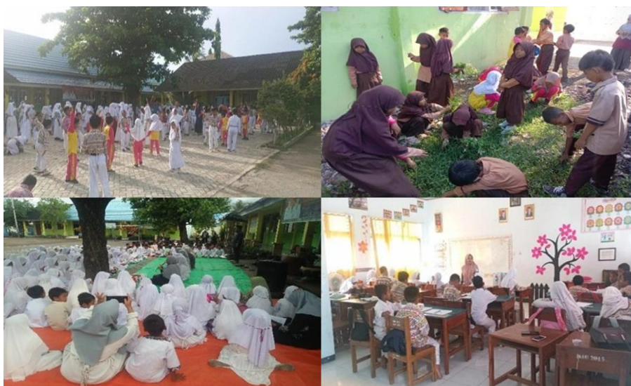
Gambar 2. Kegiatan siswa yang mencerminkan internalisasi nilai moral melalui budaya sekolah

membentuk sistem kohesif yang memfasilitasi pengembangan perilaku moral siswa secara nyata dan dapat diamati