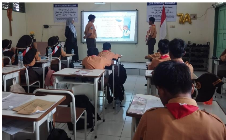
Gambar 2. Aktivitas berbicara siswa menggunakan metode Talk and Dare

penelitian terdahulu yang mengemukakan metode pembelajaran aktif bisa meningkatkan kemampuan berbicara siswa (Albina, Madeniet, & Abai 2025).