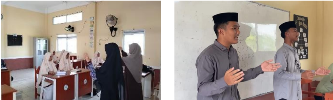
Gambar 4. Dokumentasi Kegiatan Microteaching oleh Santri

Konsep microteaching pada gambar di atas menekankan pada praktik nyata dari susunan latihan yang telah diberikan selama tahap pembekalan. Materi yang diajarkan dari awal pembekalan hingga akhir disampaikan para santri tersebut layaknya seorang guru, dengan mengikuti rangkaian kegiatan yang telah disusun rapi oleh mereka sendiri. Secara keseluruhan, dapat dideskripsikan bahwa aspek kompetensi pedagogik yang menjadi perhatian kepada santri melalui tahap pembekalan meliputi aspek perencanaan pembelajaran melalui penyusunan rancangan pembelajaran (RPP) dan pengenalan gaya belajar siswa, aspek keterampilan penyampaian yang mencakup komunikasi efektif dan pengembangan media ajar sederhana, serta implementasi melalui simulasi praktik mengajar ( microteaching ).