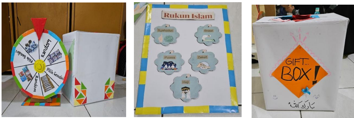
Gambar 3. Dokumentasi Media Ajar Santri

Dengan memahami metode dan gaya belajar yang beragam, santri akan lebih mudah memetakan kreativitas mereka dalam merancang media ajar. Dalam pelatihan ini, media ajar yang dibuat berasal dari bahan-bahan sederhana seperti kardus dan origami, yang dikombinasikan dengan gambar berwarna sehingga terlihat lebih menarik.