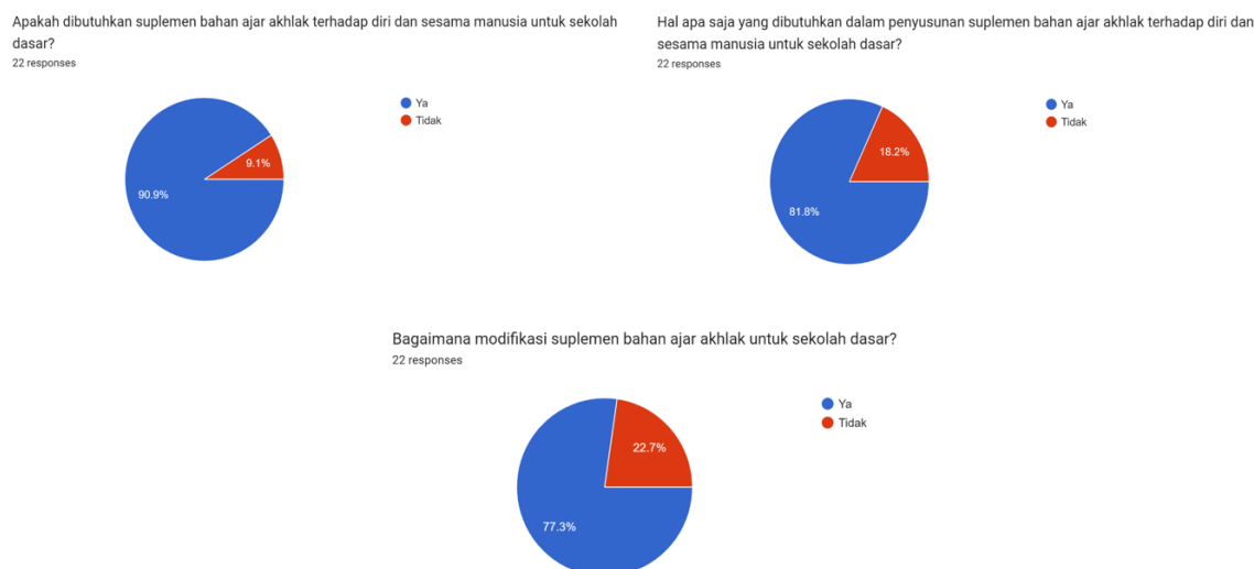
Gambar 1. Hasil uji analisis kebutuhan

Menurut 22 responden terkait pengembangan suplemen bahan ajar akhlak sangatlah dibutuhkan untuk sekolah dasar tujuannya agar memiliki akhlak yang baik. Terkait dalam penyusunan suplemen bahan ajar akhlak 81.8% menjawab bahwa responden menyampaikan kebutuhan dalam penyusunan bahan ajar terkait pembahasan akhlak terhadap diri dan sesama manusia 18.2% menjawab bahwa responden menyampaikan kebutuhan dalam penyusunan bahan ajar terkait pembahasan akhlak terhadap sesama manusia. Terkait dalam modifikasi bahan ajar akhlak 77.3% menjawab bahwa responden menyampaikan modifikasi dalam penyusunan bahan ajar untuk pembahasan akhlak terhadap diri dan sesama manusia dan 22.7% menjawab bahwa responden menyampaikan modifikasi dalam penyusunan bahan ajar untuk adanya pengembangan warna, gambar, serta lembarLatihan soal agar lebih menarik.