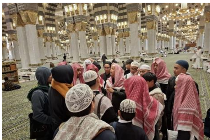
Gambar 3. Kegiatan Pembelajaran di Masjid Nabawi

Penerapan metode experiential learning ke tempat bersejarah dalam pembelajaran sirah nabawiyah di Lembaga Tahfiz Yayasan Annor Bakti tidak hanya bersifat rekreatif, melainkan dirancang sebagai bagian dari strategi pendidikan yang menyeluruh. Pendekatan ini memperlihatkan bahwa kunjungan ke tempat bersejarah tidak diposisikan sebagai kegiatan tambahan semata, melainkan sebagai media pembelajaran yang memiliki nilai pedagogis yang tinggi. Selama kegiatan berlangsung, metode ceramah dari ustadz pembimbing dikombinasikan dengan visualisasi objek sejarah yang ada di lokasi. Santri tidak hanya mendengar penjelasan secara teori, tetapi juga menyaksikan langsung tempat-tempat penting dalam sejarah dakwah Rasulullah Shallallāhu 'alaihi wa sallam . Pengalaman ini memberikan kesan mendalam yang tidak bisa didapatkan hanya dari membaca buku atau menyimak pelajaran di kelas. Para santri menjadi lebih terlibat secara emosional dan spiritual, sehingga pemahaman mereka terhadap kisah sirah menjadi lebih utuh dan menyentuh hati.