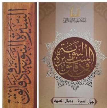
Gambar 2. Kitab Rujukan