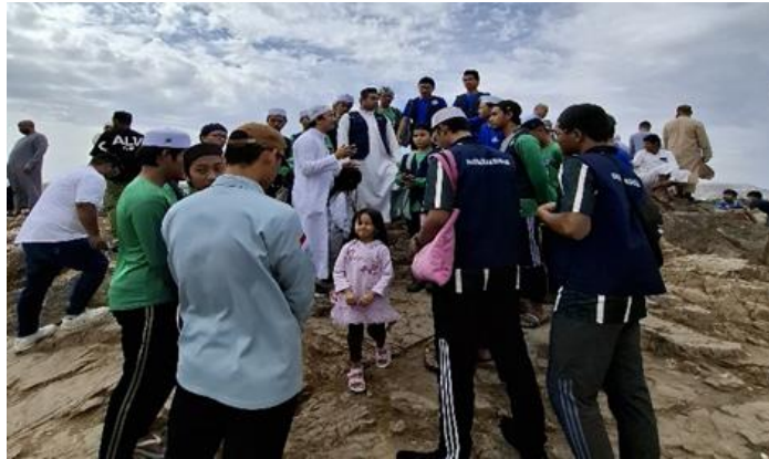
Gambar 4. Kegiatan Pembelajaran di Jabal Uhud

penting seperti mihrab Nabi dan para Khalifah setelah beliau, area rumah Nabi dan istri-istri beliau dan sebagainya.