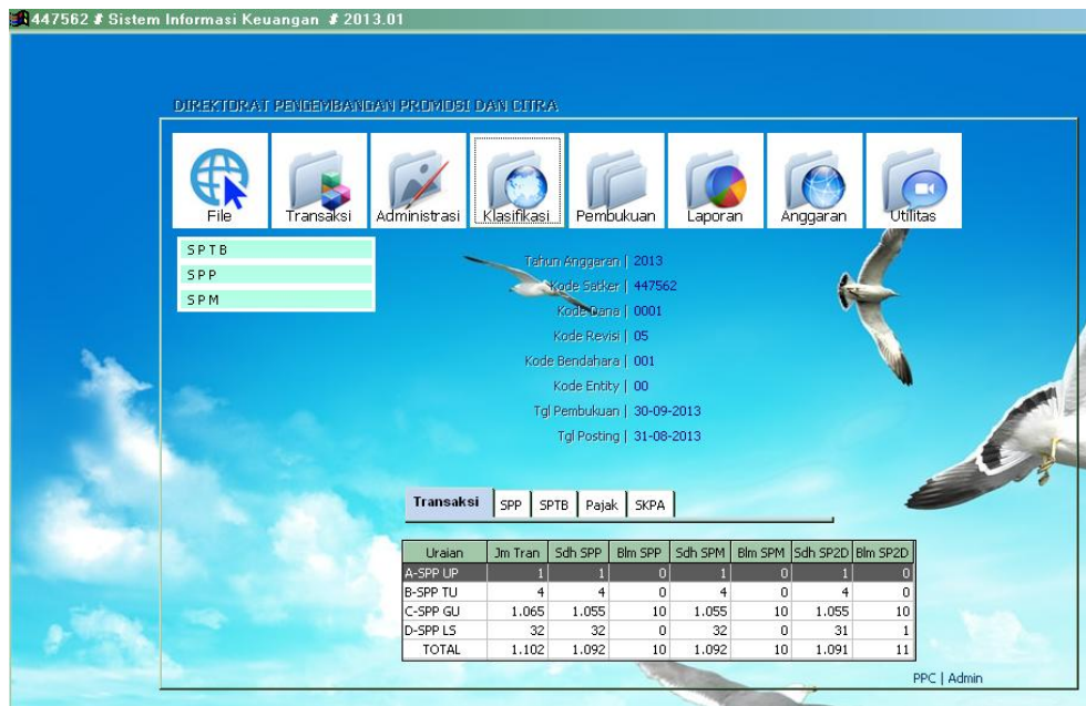
Gambar 4.3 SISKA Menu Klasifikasi

Sumber : Aplikasi SISKA PT. Multi Script.