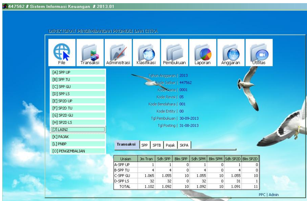
Gambar 4.1 SISKA Menu Transaksi