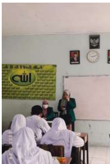
Gambar 1. Jadwal Bimbingan dikelas 8G

Berikut disajikan pula dokumentasi ketika layanan klasikal berlangsung: